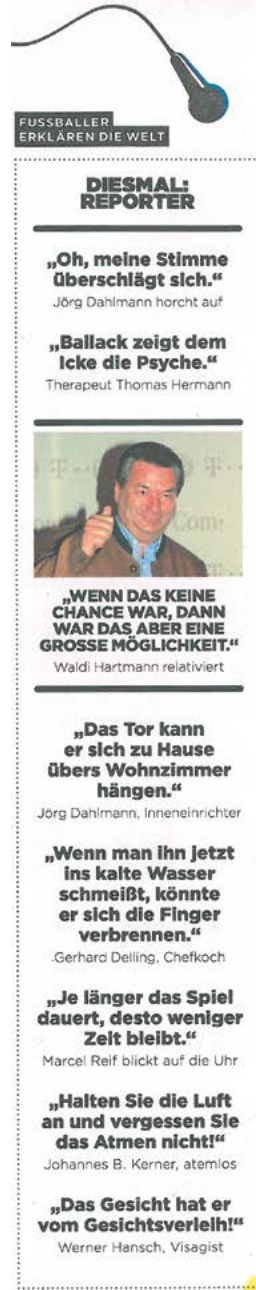
... Bericht aus 11 Freunde 03/2019