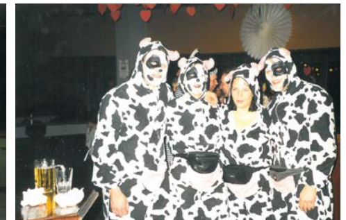
... Rot-Weisse Nacht 02/2000

... Bericht aus Fußball in Bremen und Bremerhaven 1977/1978