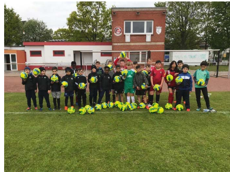
Der Vorstand des FC Sparta Bremerhaven