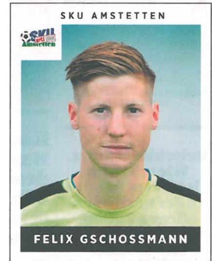
... Bericht aus 11 Freunde 03/2019