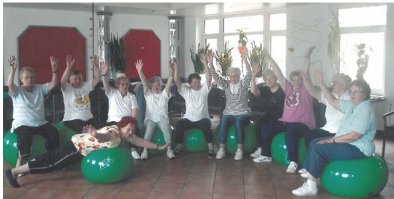
Gymnastik im Vereinsheim Juni 2010