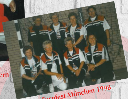
Turnfest München 1998

Das waren noch Zeiten, als wir außer Seniorenturnen auch noch Kinderturnen angeboten haben