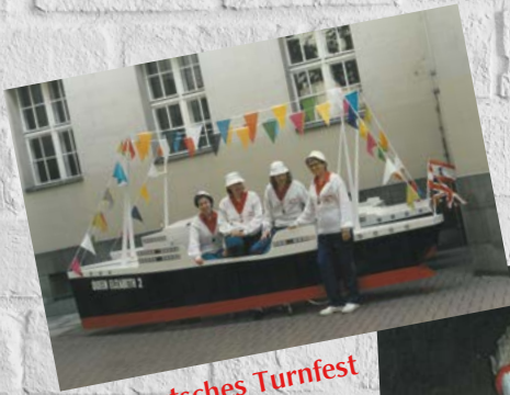
1. Deutsches Turnfest Berlin 1987