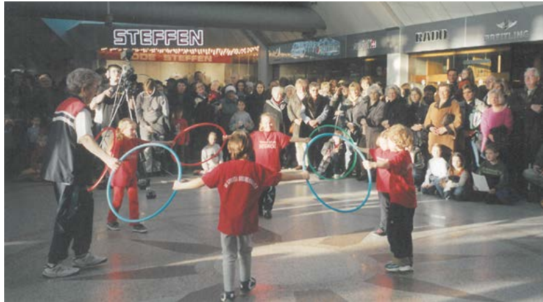
Vorführung Sportmeile 2002