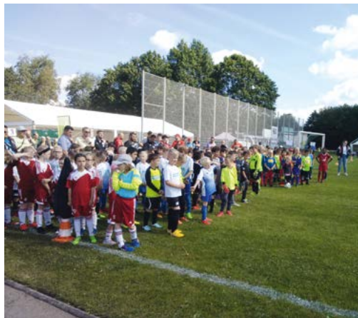
Auszug Sonntagsjournal vom 23. Juni 2019