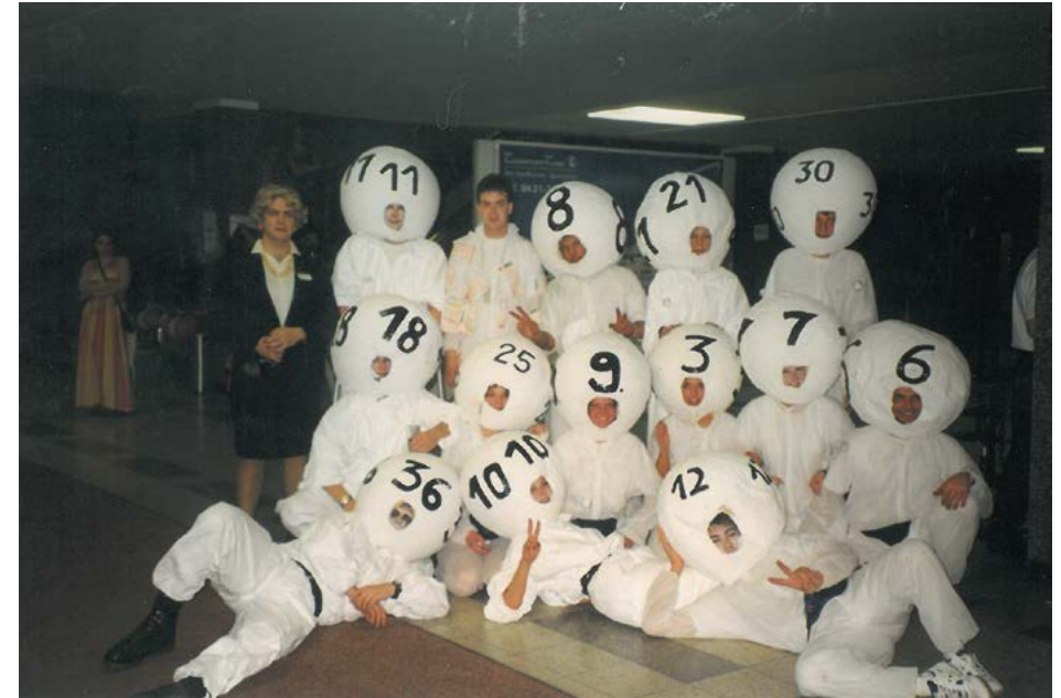
... Rot-Weisse Nacht 02/1999

Die Liga wird zur nächsten Saison in 3. Kreisklasse umbenannt.