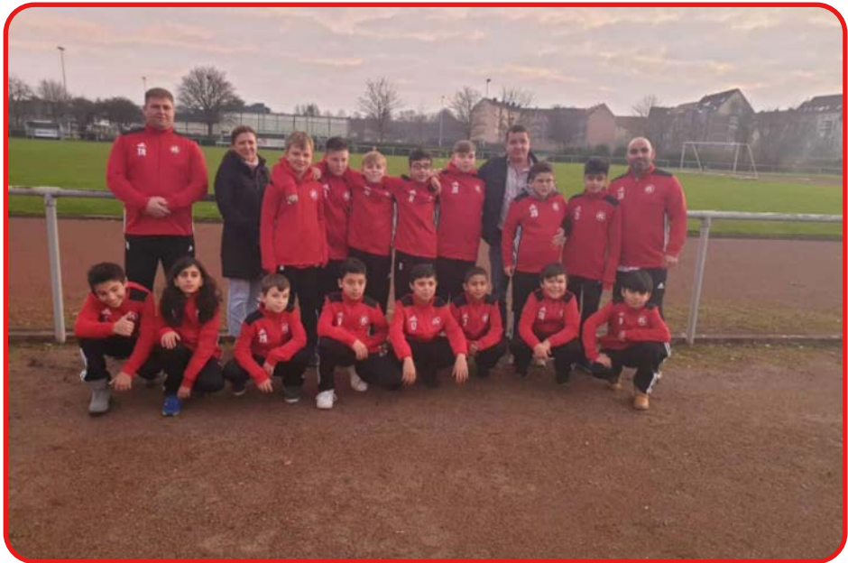
Das Trainerteam der D2-Jugend