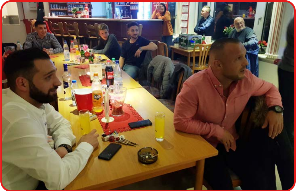
Eure Trainer von der 1.Herren